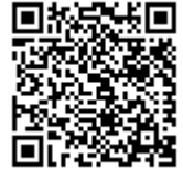
ABB S203P-C20 2CDS283001R0204 4016779590624 EAN/GTIN

113,84 EUR IVA incluido** más Gastos de envío